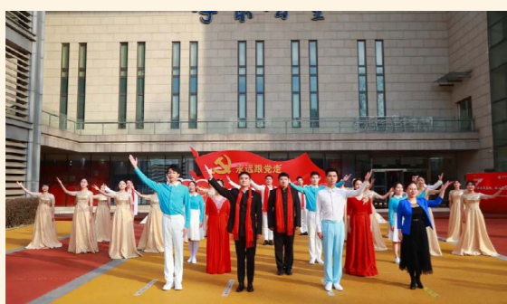
新年第一天，中财大师生在校园内唱响《领航》，一天两次上央视

“伟大的中国共产党，风华正茂，山高水长……”新年伊始，中央财经大学师生在校园内唱响歌曲《领航》的身影登上中央电视台新闻联播和新闻直播间，师生深情地表达对党的颂扬、对党的热爱。师生们的真情实感、昂扬风貌是学校党史学习教育成效最生动的体现。