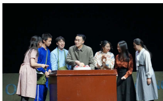
原创大师剧《姜维壮》再度成功上演

“您的著作和精神，必将在前行的路上激励所有中财大人”。伴随着大幕的缓缓落下，掌声雷动，久久不息，中央财经大学原创大师剧《姜维壮》再度成功上演，大师剧多维度呈现了中国财政理论“终身成就奖”获得者姜维壮先生平凡而又伟大的一生。在建党100周年之际，新增“筚路蓝缕”场景，生动展现中财大人在不同时期艰苦奋斗、矢志强国的故事。大师剧连演三场，成为校园的一项文化盛事，用中财大学人的“忠诚坚定的爱国精神、求实创新的治学精神、团结无私的奉献精神”来滋养师生心灵、涵育师生品行，激励师生以更大的作为来诠释和传承“财经黄埔人”为国而生、与国同行的使命和担当。