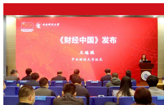
举办中国共产党百年财经思想与实践研讨会

学校立足学科特色，围绕习近平新时代中国特色社会主义思想展开研究阐释。与北京市习近平新时代中国特色社会主义思想研究中心联合举办“中国共产党百年财经思想与实践研讨会”，征集到校内外20余篇优秀成果，邀请到经济日报社副总编季正聚、清华大学人文学院陈争平教授等知名专家以及高校学者做主旨报告，并在学校的《中央财经大学学报》《财经法学》《高校马克思主义理论教育研究》开辟“建党100周年”专栏全面展现党的百年财经思想理论阐释成果。各二级党组织积极挖掘学科史、提炼学科思想、推进党的创新理论发展，财政税务学院开展“中国学派”的“新市场财政学”财政基础理论研究；金融学院围绕“中国共产党领导下的金融思想和金融实践伟大成就”立项研究课题；法学院围绕党的法制体系系列微党课。组织开展了“中国共产党与爱国主义教育”“中国共产党百年金融思想研讨会”“中国共产党领导下的金融开放：回顾与前瞻”“中国共产党百年财税治理思想与实践”“后疫情时代的新国家理财专题研讨会”等多场高水平研讨会，极大地丰富了党的创新理论内容体系，为推动中国特色、中国气派、中国风格的哲学社会科学体系构建做出中财大贡献。