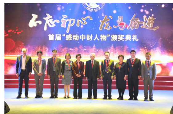
首届“感动中财人物”颁奖典礼

历史的榜样举起信念明灯，身边的榜样聚起前进力量。学校评选表彰首届“感动中财”人物及团队，获奖者中有折翼奔跑、逆风飞翔的优秀学子，有心地纯真、甘于奉献的“最美志愿者”，有闻令而动、舍小家为大家的扶贫干部和援派教师，有在“绿金”领域开门立派的青年学者；还有春风化雨育桃李的金融学慕课团队，不畏生死勇敢逆行的疫情防控医疗团队，勇摘桂冠为校增光的女子排球队，用镜头和笔杆为母校代言的校园通讯人……他们的感人事迹，凝聚起中财大校园最温暖的力量，为中财大精神注入新的时代内涵。