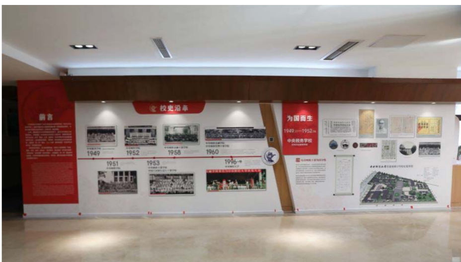
二层回廊历史沿革展