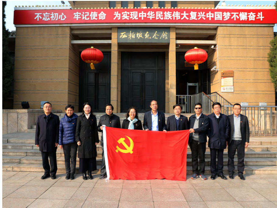
参观西柏坡纪念馆

的宝贵精神财富。通过这次学习，重温党的历史，深入了解了中央进驻西柏坡的历史背景，进一步领会了西柏坡精神和“两个务必”的深刻内涵。今后工作中，不仅要对照党章找差距，也要对照西柏坡精神找差距，要认真学习 and 继承老一辈革命家艰苦奋斗、不畏艰难、敢于斗争、敢于胜利的革命精神和优良传统，奋发进取，团结一心，为学校事业发展贡献自己的力量。