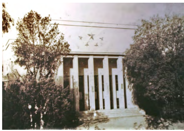
中央税务学校大礼堂照片