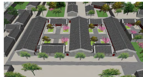
南北四合院复原图

在校门内的北边,是大门院和东北院,东北院的院门很漂亮,有一个拱形的月亮门。东北院的北边有一座仓库,叫北仓库,还有一个北小院。在北小院的西边,一路之隔,是3排自南向北的东西向平房,位于小北院——昌堂院的西边,叫做昌堂门头条、二条、三条,构成了昌堂院院。它们当时是建筑工人盖礼堂和楼房时的工棚。昌堂院的南边是一座建于1951年的二层学生员宿舍楼,叫人字楼。据学校大事记记载,1951年上半年,中央财政学院筹备期间,在22号院内建筑楼房200间。华北税务学校在购买22号院之前,这里只有平房,没有楼房。在人字楼的南边有一个花园,位于人字楼和大礼堂之间,里面有座土山。