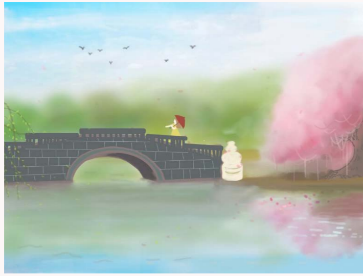
(文/金融学院 2019级金融 马映玮 图/文化与传媒学院 2019级视传 何小雪)

南风知我意，吹梦到西洲。前年北上求学后，再难有在昆明历春的机会，今年虽待在昆明，却也因疫情无法见得那些魂牵梦绕的图景了。我放下画笔，默默凝视着这一卷心里昆明的春。温柔的风还未停歇，便让它也赏一赏这画卷，再替我去那真实的景里，道一声想念。