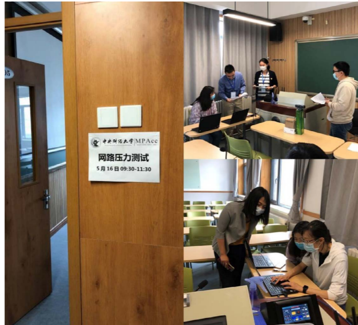
学院南路校区网络压力测试现场

5月16日,研究生院与智慧校园建设中心组织各招生学院在两校区开展网络压力测试。研究生院对全院人员进行了任