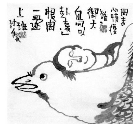
周末心情复杂：御大鸟以趋远，恨周一还上班