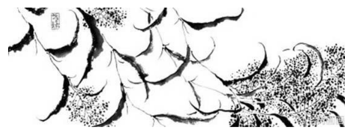
最爱江南废园，久旷无人花残，夜半独倚竹下，一轮明月正圆。