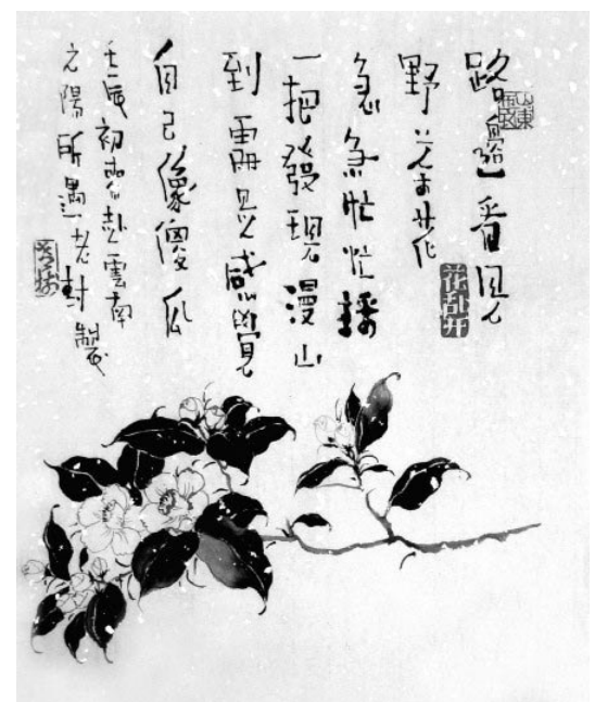
是，路边看见野茶花，急急忙忙采一把。发现漫山到处