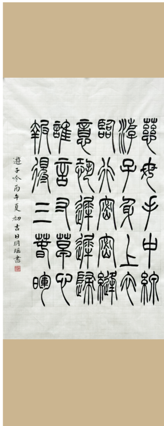
（文化与传媒学院 2025 级本科生 宋玥瑶）