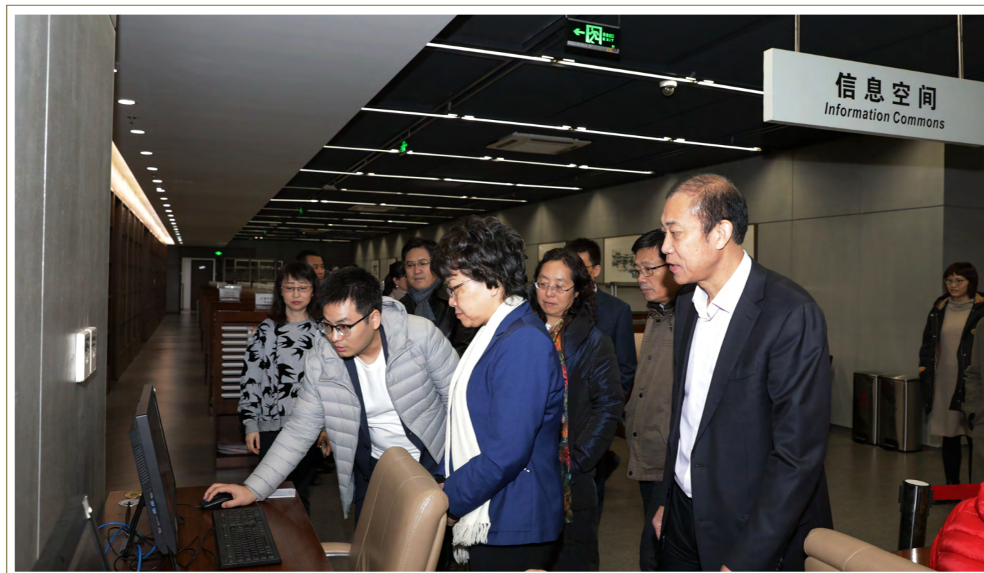
◆ 11月21日上午,教育部党组成员、副部长翁铁慧来到中央财经大学,对学校党建、思政课建设、“不忘初心、牢记使命”主题教育开展情况和“双一流”学科建设情况进行调研指导。图为翁铁慧一行考察沙河校区图书馆。

本报讯 11月21日上午,教育部党组成员、副部长翁铁慧来到中央财经大学,对学校党建、思政课建设、“不忘初心、牢记使命”主题教育开展情况和“双一流”学科建设情况进行调研指导。国务院学位委员会办公室主任、教育部学位管理与研究生教育司司长洪大用,教育部社会科学司副司长徐艳国等陪同调研。校党委书记何秀超,校长王瑶琪,校党委副书记梁勇、陈明,副校长史建平,总会计师蔡艳艳,副校长孙国辉、朱凌云以及相关职能部门、学院负责人参加调研座谈会。座谈会由何秀超主持。 翁铁慧对我校党建和思政工作、思政课建设、主题教育开展情况以及“双一流”学科建设取得的成效给予充分肯定。她指出,中央财经大学是新中国成立后由中央人民政府创办的