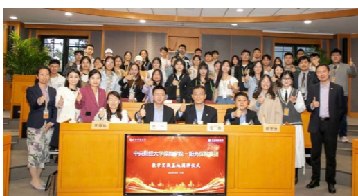
教学实践基地揭牌

形成“金课引领、国际对标、辐射全国”的课程建设模式。 精算学相关本科课程获得英国精算师考试CT系列课程和高级课程CA1免试认证（亚洲唯一），获得北美精算师协会最高级别的CAE（卓越精算教育中心）认证（大陆首个），同时还获得北美产险精算师协会大陆地区最高伙伴认证。《中国科学报》头版头条报道了我校精算认证课程建设情况。此外，学院还具有英国CII和澳新学会大陆地区最高课程免试认证资格。