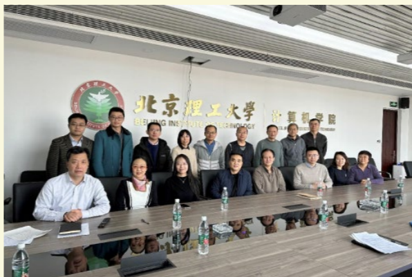
“人工智能+保险”人才培养项目交流会

“智能+保险”校际联合人才培养项目构建了一种全新的人才培养模式。该项目旨在提升学生在数字化转型、科技创新、风险管理和企业经营中的技术应用能力和领导能力，探索培养具有前瞻性思维、能够适应和引领未来保险行业发展趋势、满足保险公司数字化转型和国家新质生产力发展需求的新型复合人才。