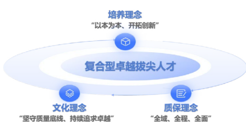
学院培养目标与发展理念

坚持“全域”质保。 依托学校教学质量保障体系，成立相关质保机构，实现针对本科教学各个领域的全覆盖。坚持“全程”质保，针对学生从入学到毕业的全流程进行质量把控，保证学生的培养质量。坚持“全面”质保，针对学生的知识水平、科研水平、实践能力等方面进行全面培养，“五育”并举培育“四基、八能、四素”高质量人才。