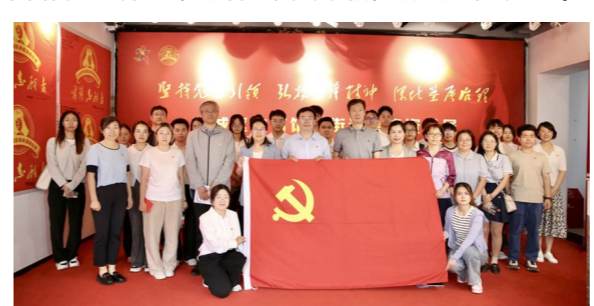
党支部党员赴体育馆路街道实地研学

政府管理学院本科生第一党支部现有师生党员18名，其中教工党员2名，学生党员16名。党支部在学校、学院党委领导及悉心指导下，对标“七个有力”，有步骤、有创新地实施“三阶行动计划”，即一阶规范化建设、二阶精准化建设、三阶个性化建设，使学生党支部成为团结学生的核心、教育党员的学校、攻坚克难的堡垒。