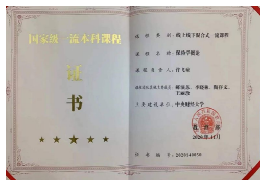
国家一流本科课程 - 保险学概论

誉英国精算师1人，英国准精算师2人，校级教学名师1人，校级优秀教师1人，龙马学者特聘教授1人，首批龙马青年学者1人。拥有国家级课程3门、北京市教学或育人团队2个、北京市精品或优质课程4门、北京市校外优秀实训基地1项、北京市精品或优质教材3本。学院教学成果被《中国科学报》和《中国财经报》专题报道。