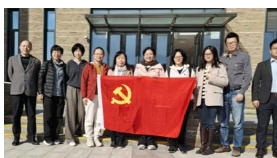
党支部开展主题党日活动

保险学院保险系教工党支部现有党员13人，全部为中共正式党员，支部委员会委员3人。支部成员100%拥有博士学位，博士生导师4人，副高级以上职称占比85%，92%的党员有海外留学背景或国外访学经历。支部成员拥有北京市教学名师2人，北京市高等教育优秀专业主讲教师1人，教育部新世纪优秀人才1人，北京市青年英才1人，在保险学科发展和保险专业人才培养方面发挥着重要作用。