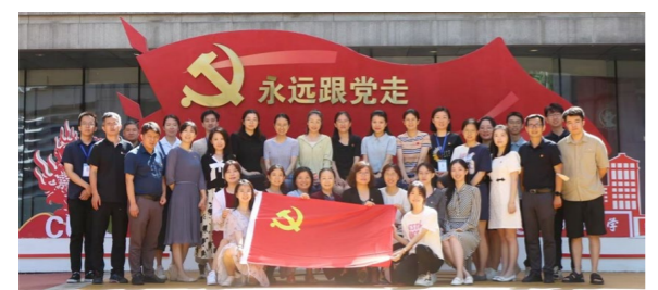
党支部举办庆祝建党102周年主题党日活动

机关党委学生工作部、学生处、武装部党支部现有教工党员26人。在学校党委和机关党委的领导支持下，党支部坚决落实立德树人根本任务，持续推进“一融双高”。在“大学工”视域下，工作贯穿从本科生招生“入口”到就业“出口”学生工作的各个环节，涵盖本科招生、思想教育、助学服务、学生管理、心理健康、就业创业指导、学生工作发展、国防教育等8个学生工作模块。党支部坚持党建与业务齐抓共管，强化“质量党建、精准思政、精细支持、系统推进”，严格做到“七个有力”，有效发挥党支部的政治功能、组织功能和服务功能，全面助力学生成长成才。2023年，党支部获评“北京高校先进基层党组织”“中央财经大学2021—2023年度先进基层党组织”荣誉称号。