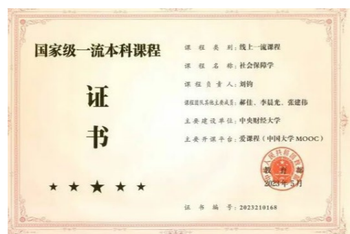
国家一流本科课程 - 社会保障学

教研相长，持续提升科研质量。 学院依托教育部人文社科重点研究基地—中国精算研究院，持续推动科研成果的产出与转化，反哺教学以提升人才培养质量。学院积极邀请国内外学者共举办300余场学术讲座，涵盖精算、金融、保险、风险管理等多个领域。