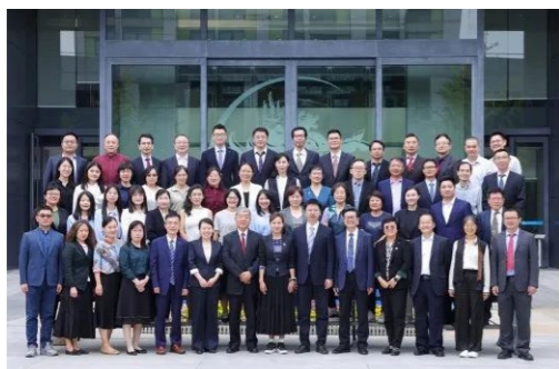
学院党委获评北京高校党建工作“标杆院系”培育创建单位、北京高校先进党组织

坚持党的全面领导。 围绕国家重大战略需求，以服务国家、服务首都、服务环首都经济圈的重大战略需求为导向，着力将学生培养为具有“保险固国安邦，精算洞见风险，保障惠济苍生”价值责任的德智体美劳全面发展的中国特色社会主义事业建设者和接班人。积极回应“建设教育强国，保险学院何为”的时代课题，坚持“扎根中国大地办大学”，服务经济社会发展。