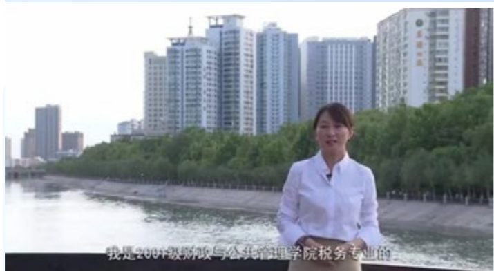
我是2001级财政与公共管理学院税务专业的