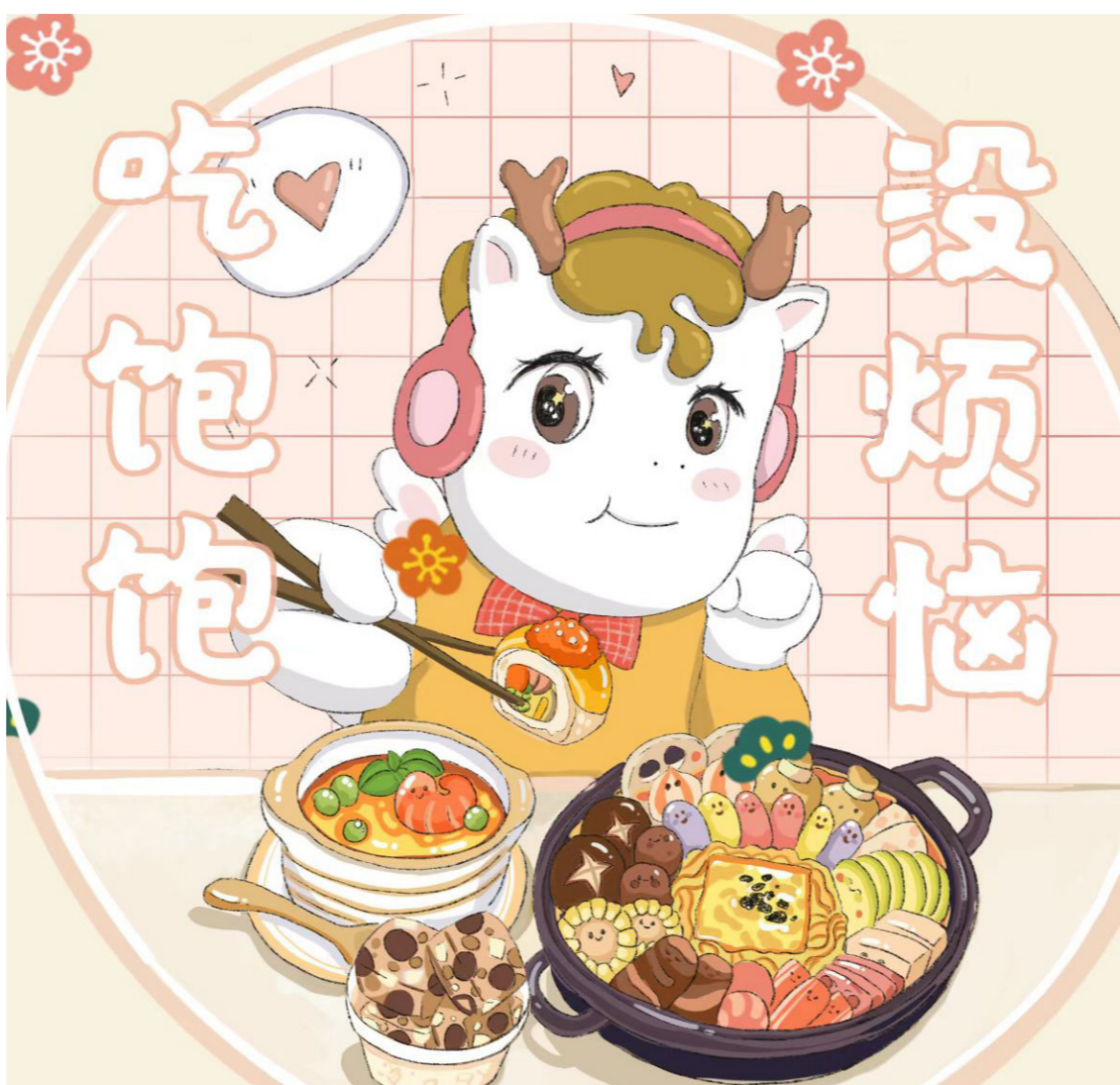
(图/文化与传媒学院 2022级视传 梁子琦)