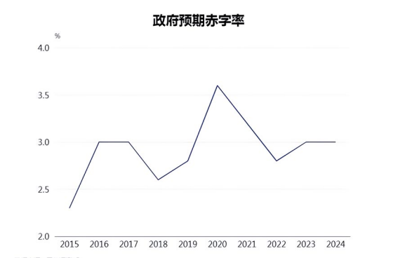
与其他国家相比我国赤字率在过去长期保持相对较低水平

最后是更加重视财政政策与货币政策的协调配合。中央经济工作会议强调“要打好政策‘组合拳’。加强财政、货币、就业、产业、区域、贸易、环保、监管等政策和改革开放举措的协调配合”，着重提到要“加强财政与金融的配合，以政府投资有效带动社会投资”，凸显了财政政策与货币政策在提升宏观调控整体效能方面所扮演的重要角色。