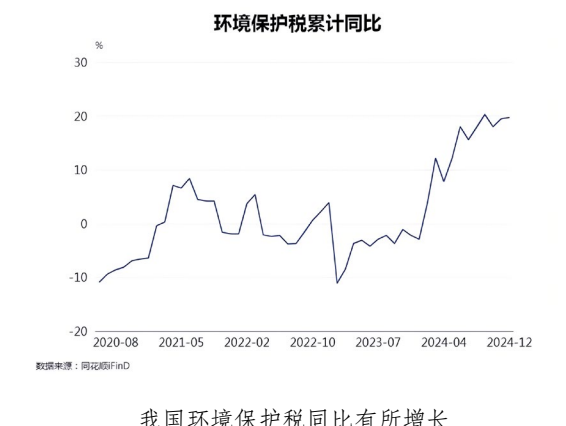
我国环境保护税同比有所增长

最后是构建适应新业态的税收制度。在短期需要通过优化征管模式、调整税收分配规则提升适应性。在长期需研究数据的可征性和开征数字税的可行性。应对“双碳”目标，催生绿色产业、绿色服务、绿色投资等，不断深化环境保护税、资源税、消费税、车辆购置税等绿色税种的改革，不同税种间协同发力，引导绿色产业发展。