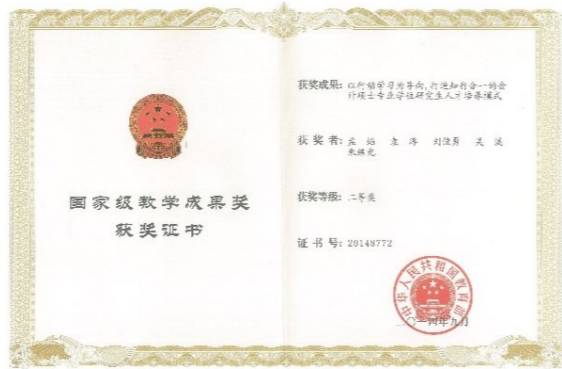
国家级教学成果奖

教学成果特色突出。 学院坚持“以本为本”，大力推动会计学、财务管理两个一流本科专业建设，先后获评多项教学重要奖项。